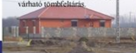
A Nap és Hold Alapítvány új épülete

A képviselő-testület belterületbe csatoláshoz történő hozzájárulásával látványosan megindult a Csépi út mellett lévő volt 045-ös földrészlet rendezése, beépítése is. A város egy újabb hangulatos lakónegyeddel gazdagodhat, hiszen a lakossági kezdeményezéssel megindult fejlesztés modern, kertvárosi lakóterület kialakulását eredményezheti. A kertvárosi jelleg megőrzését erősítette meg a képviselő-testület azzal a döntésével, hogy a kertvárosi lakóövezetekben építhető lakások számát korlátozta. Telkenként egy db egylakásos lakóépület építhető. A rendezési tervben biztosított lehetőségek alapján, a közeljövőben lakossági kezdeményezésre, több helyen várható tömbfeltárás.