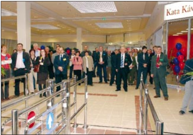
Meghívott vendégek nyitás előtt

Százhatvan munkahelyet teremtett a Tesco Tökölön