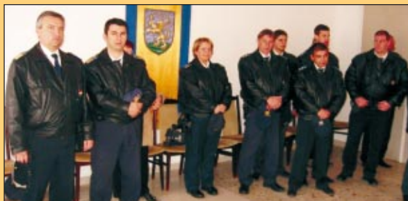
Megújult épületben, új helyen a rendőrőrs és a Védőnői Szolgálat (Folytatás az 5. oldalon)