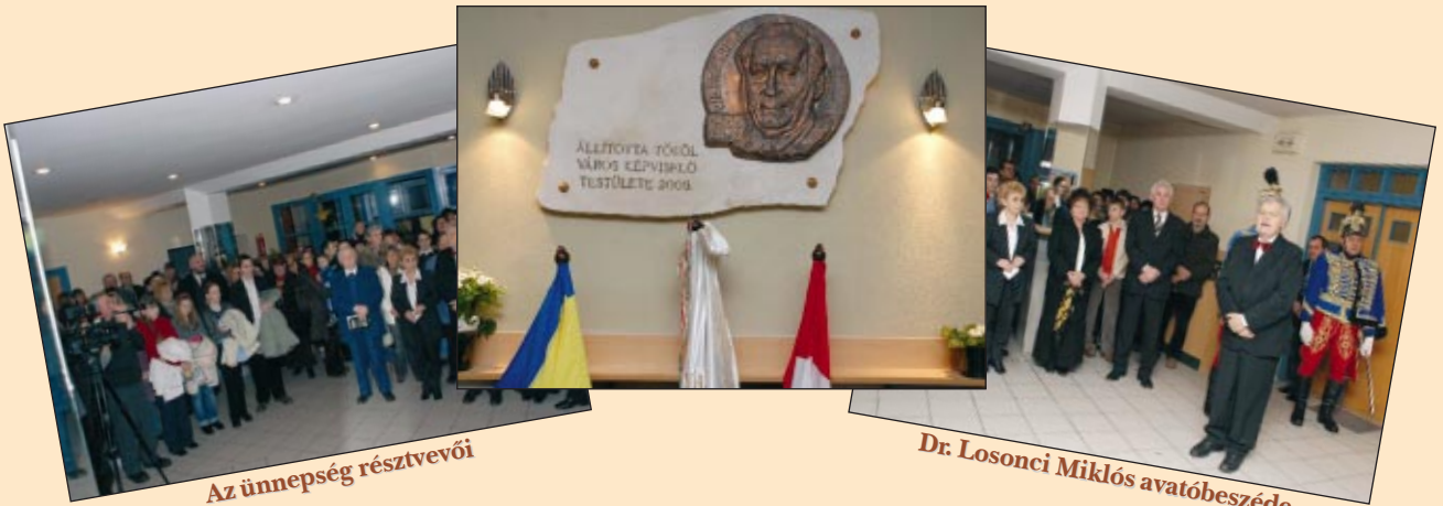
Az ünnepség résztvevői