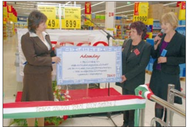
A Tököl Szociálpolitikai Fejlesztéséért Alapítvány vezetői átvették az 500 eFt adományt