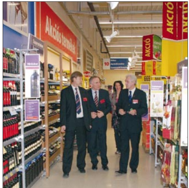
Polgármesterek első látogatása a Tesco-ban

Tökölön a város közalapítványa részesül az 5 forintért értékesített bevásárlószatyrokból befolyt összegből, így módon az áruházlánc a munkahelyteremtésen túl hozzájárul a városban élő hátrányos helyzetű gyermekek és fiatalok támogatásához is.