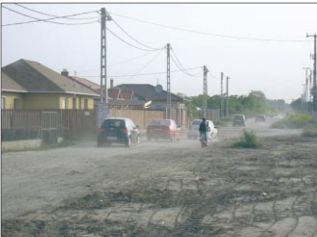
Kalandtúra: Halásztelken már a belső utakon kerülnek az autók

Az optimista változat szerint 2009. augusztusban meglesz a területek 90%-a, 2009 októberére befejeződik a régészeti kutatás, 2009 augusztusára megtörténik a kivitelező közbeszerzés általi kiválasztása, 2009 novemberében megkezdődhetnek a munkálatok.