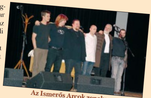
Az Ismerős Arcok zenekar