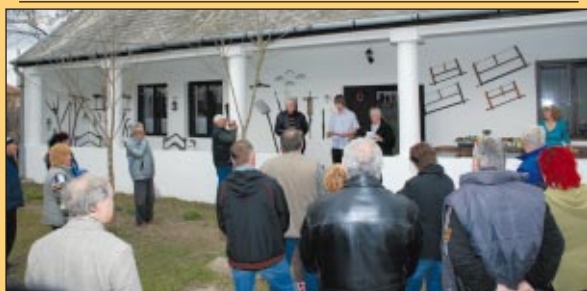
Hagyományok Háza néven ismét látható a helytörténeti gyűjtemény (Folytatás a 4. oldalon)