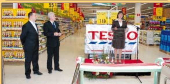
Április 3-án átadták a Tököli Tesco Bevásárlóközpontot (Folytatás a 22. oldalon)