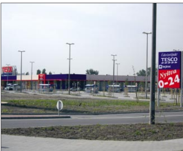
Impozáns látvány kívül és belül