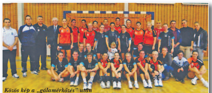
Közös kép a „gálamérkőzés” után