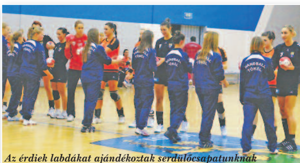
Az érdiiek labdákat ajándékoztak serdülőcsapatunknak