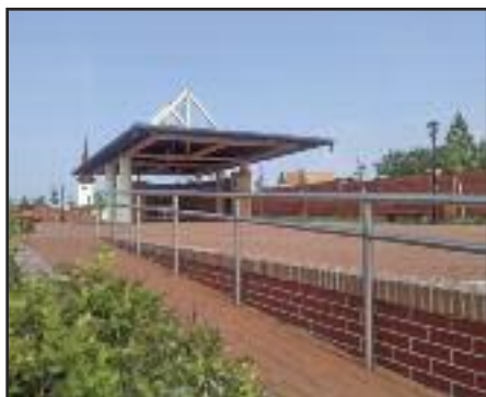
Piac tér új