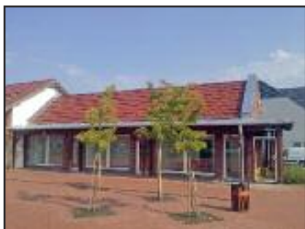
Kis üzletház új