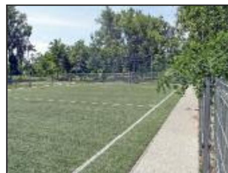
Műfüves focipálya új