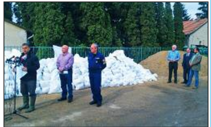
Orbán Viktor miniszterelnök Tökölön az árvízi védekezésben