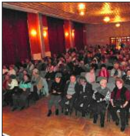
Nyugdíjas karácsonyi ünnepség