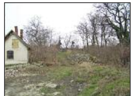
Kis üzletház régi