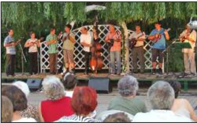
Perkovas együttes a Zenés Nyári Estén