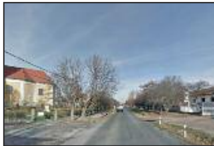
Fő utca régi