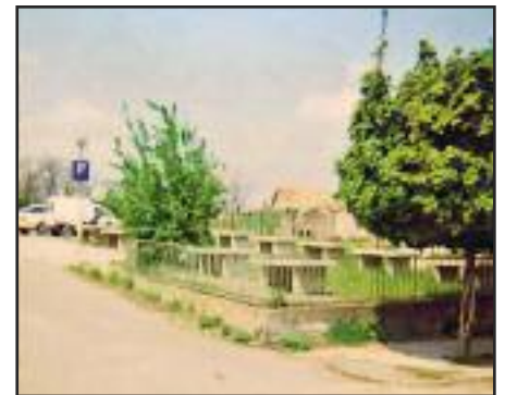
Piac tér régi