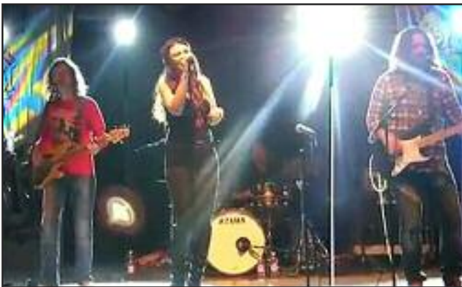
Rúzsa Magdi koncert