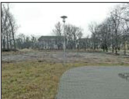
Műfüves focipálya régi