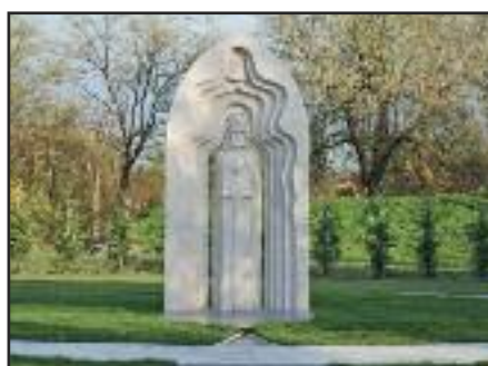
II. Lajos emlékmű új