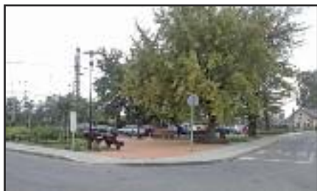
HÉV állomás új