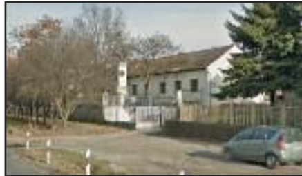
1848-as emlékmű régi