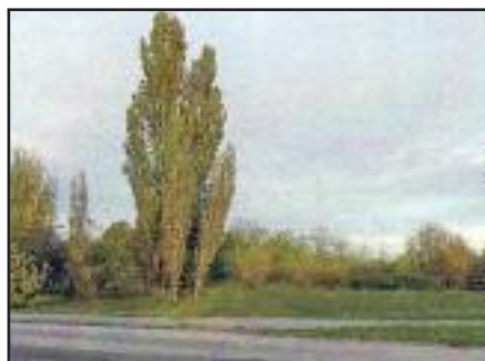
II. Lajos emlékmű régi