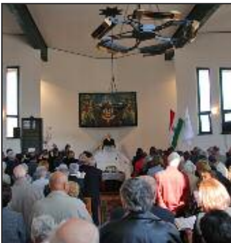
Felszentelték a református templomot