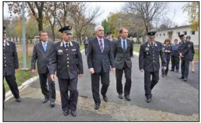
50 éves a Tököli BV Intézet