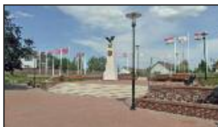
1848-as emlékmű új