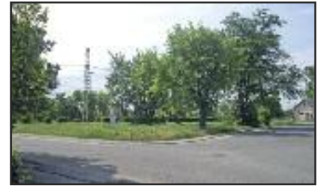
HÉV állomás régi