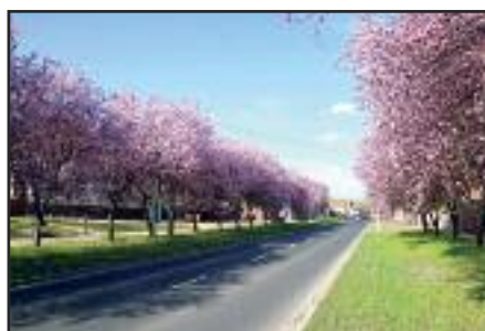
Fő utca új