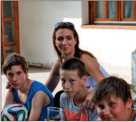
A képen a lelképásztor gyermekek gyűrűjében