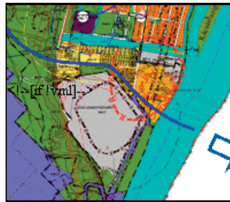
Százhalombatta Településszerkezeti terve a tervezett 101. sz. út és a tervezett híd javasolt vonalvezetésével

tervben javasolt vonalvezetést ellehetlenítenék. A börtön és az ahhoz csatlakozó gazdasági területek a tervezett úttól északra, a volt veszélyes hulladék ártalmatlanító telep (ATEV) valamint a folyékony hulladékkezelő és ártalmatlanító telep pedig az úttól délre ta-