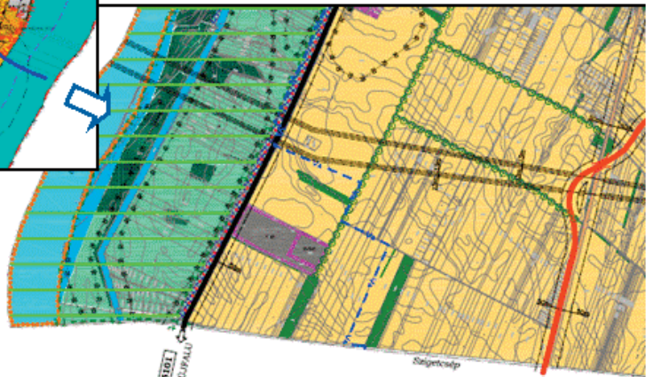
Tököl Településszerkezeti terve a tervezett 101. sz. főút tengelyében építendő híd javasolt helyszínével

kormányzatoknak egyeztetni szükséges a javasolt vonalvezetést. A tervezett főút és a Duna-híd helyét a Százhalombattán kialakult korlátok miatt csak közös gondolkodás során lehet kijelölni, de szerencsére Tököl közigazgatási területének déli részén nem találhatók olyan létesítmények, amelyek a jelen