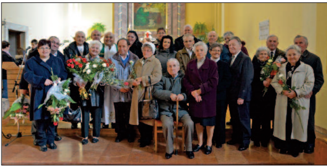
Kedves és megható esemény volt a 25, illetve 50 éves házások eskü-megerősítése a katolikus templomban. Gratulálunk minden jubiláló házaspárnak.