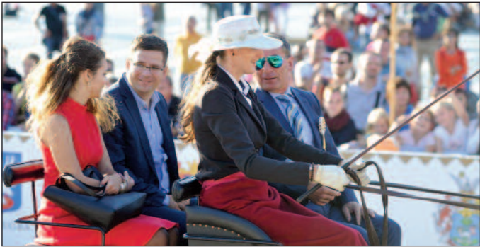
Megtisztelő, hogy dr. Seszták Miklós Nemzeti Fejlesztési Miniszter is a tököli fogaton tett tiszteletkört.