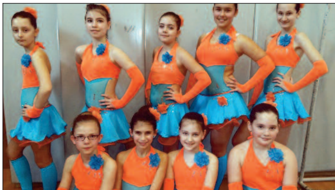
02.28. - Roses