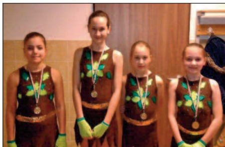
02.28. - Jungle ladies