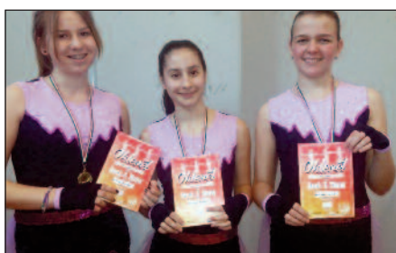
02.28. - Crazy Queens