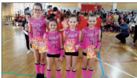
02.28. - Gyémánt csajok