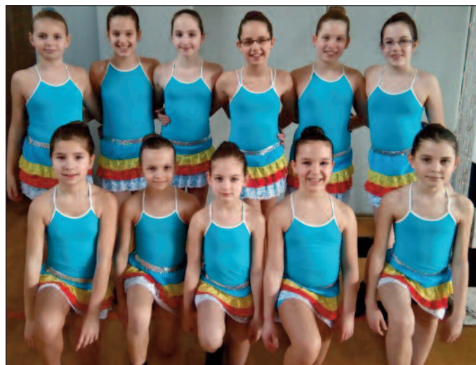
02.28. - First Class

A múlt hónapban ismét beindult az akrobatikus rock and roll-ban is a versenyszezon. Február 28-án Klubközi versenyen, március 6-án Kick Dance (utánpótlás) versenyen vettünk részt a csapatokkal. A gyerekek szorgalmas munkájának köszönhetően ismét szuper helyezésekkel tértünk haza. A nagyformációs csapatokkal áprilisban és májusban már pontszerző területi, illetve országos versenyekre készülünk.