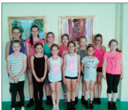
A 2015/16. tanévben versenyző csapat