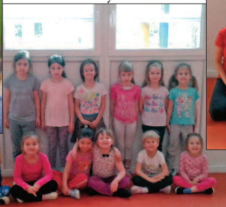
Pindúr Pandúrok csapat 2015-2016. tanév