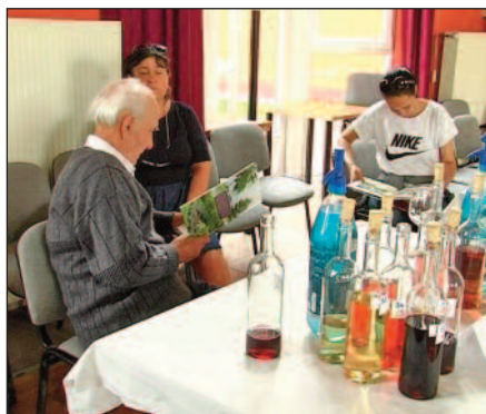
A közösségteremtés szorosan összefügg a szakmaisággal, hiszen a szőlész-borász

A szakmaiság , miszerint nem titkolt cél a szőlő és az abból készült nemes ital, a bor kultúrájának ( előállítás, fogyasztás ) mind szélesebb körben történő megfelelő elismertetése, terjesztése, a nemes szőlőfajok természetésnek elősegítése és a kevésbé értékes, ún. vadszőlők, ( direkt termők ) háttérbe szorítása.