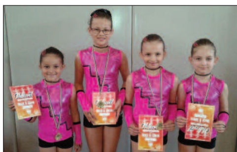
Gyémánt csajok - Arany minősítés

Tököli Tükör Kiadja: Tököl Város Önkormányzata Szerkesztő: Deáki Tímea Fotók szerkesztése: Malaczkó István Szerkesztőség: Olivamarketing Kft. Nyomda: West-Graph Kft. Szigethalom, Mű út 154.