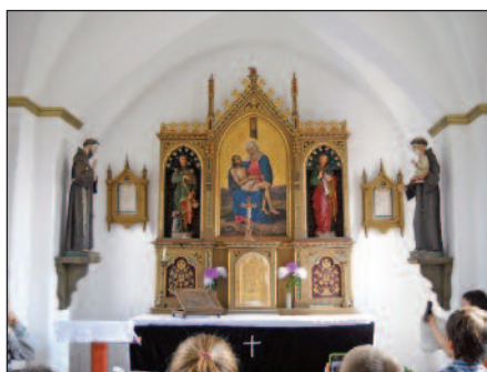
Gara, Temető, Gatti kápolna