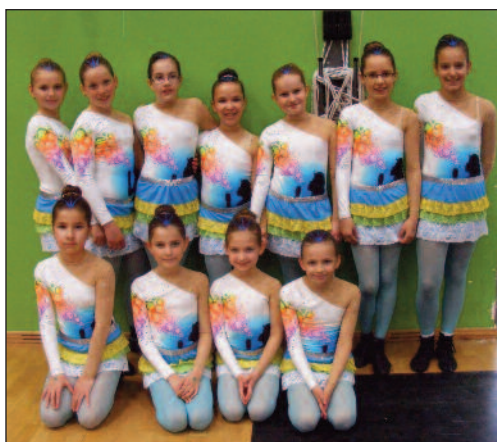
First Class - 11. hely