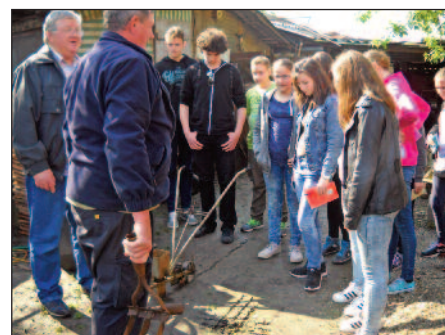
Gara, Tájház, Arsenić Simoval