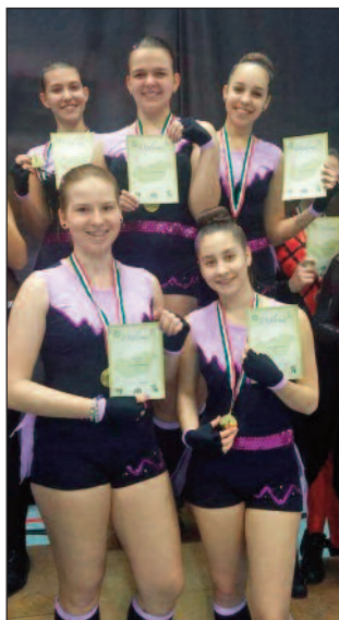
Crazy Queens 1. hely