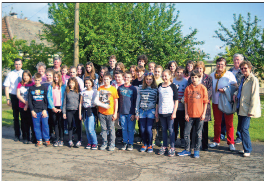
Gara, Népismereti kirándulás