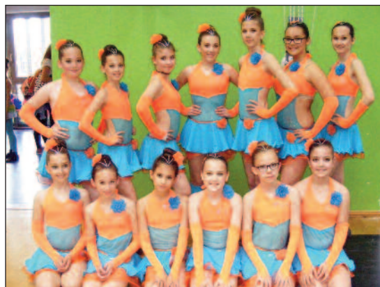
Roses - 11. hely