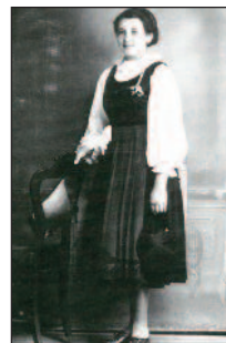
Reneszánsz festők ecsetjére méltó szépség az esküvő előtt