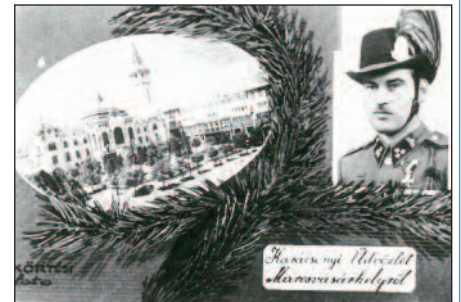
Egymás után jöttek az üdvözetek

Húsz évesen érte a „Magyarok Bejövele”. Nagy ünnepséget, katonai demonstrációt tartottak a Kis Somlyó és a Nagy Somlyó közti nyeregben.