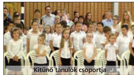
Kitűnő tanulók csoportja