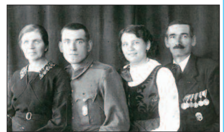
Székely család Csíksomlyóról!