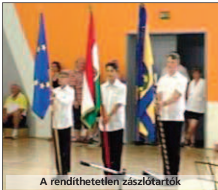
A rendíthetetlen zászlótartók