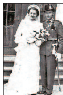
Csíksomlyói plébánia bejárata előtt