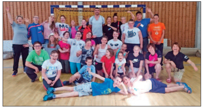
A 2017-es Sugár kapusképző tábor résztvevői