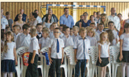
Megilletődés nélkül, elsősök az évnnyitón