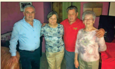
Rokontalálkozó Major-Tomin családok a Kirchnerben