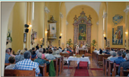
Szent István nap