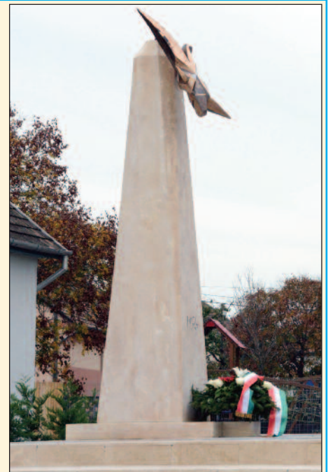
Csillagdöntés: Szórádi Zsigmond alkotása