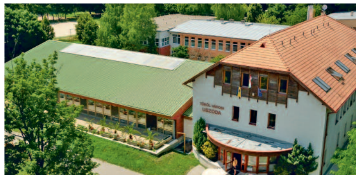
SIKERES TÉRSÉGI EGYÜTTMŰKÖDÉS, EURÓPAI SZÍNVONALÚ SZABADIDŐ-ELTÖLTÉS