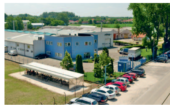
SIKERES TÖKÖLI VÁLLALKOZÁSOK, VILÁGCÉG PARTNEREK