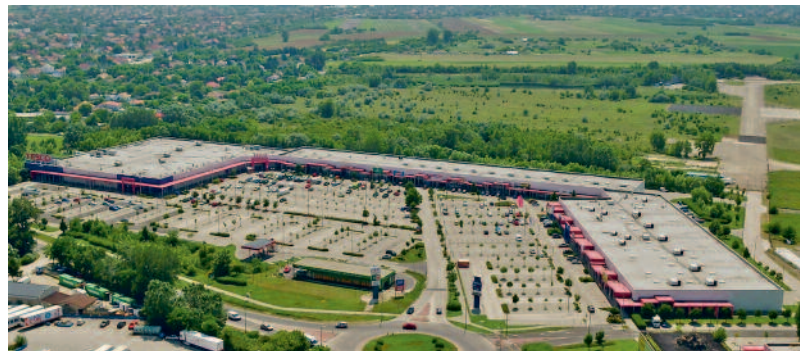
EREDMÉNYES BEFEKTETŐVONZÁS, VIRÁGZÓ KERESKEDELMI KÖZPONT