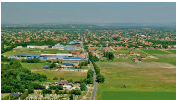
HARMONIKUS FEJLŐDÉS, VERSENYKÉPES VÁROS