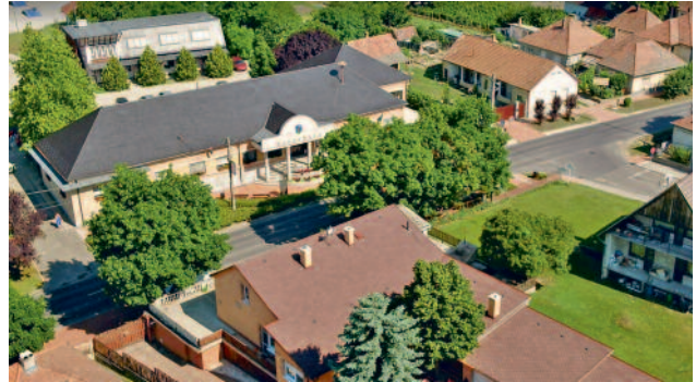
SZOLGÁLTATÓ ÖNKORMÁNYZATISÁG, KORSZERŰ KÖZIGAZGATÁS