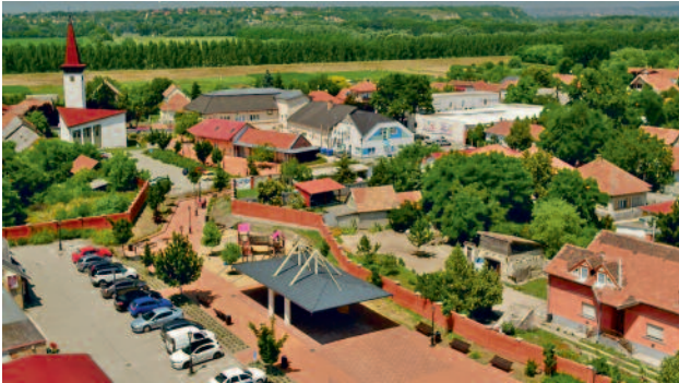
SZÍNVONALAS KÖZÖSSÉGI TEREK, IGÉNYES VÁROSFEJLESZTÉS