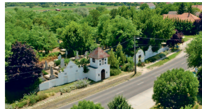
MEGÚJÍTOTT TÖRTÉNELMI ÖRÖKSÉG