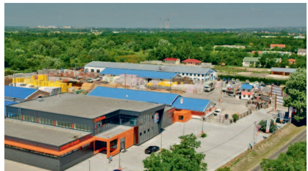
MAGAS SZÍNVONALÚ SZOLGÁLTATÁSOK, ERŐS HELYI GAZDASÁG