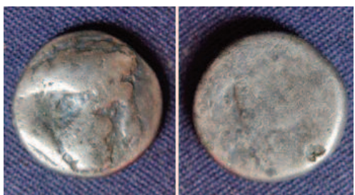
Kelta ezüstpénnel, egyik oldalán koszorús fejfel

A Duna a fémkeresősök szempontjából is kedvelt területnek számít, hiszen állandóan mozgásban van, így mindig adhat valami újat. Az köztudott, hogy Százhalombattán a római kori limeshez tartozó objektumok álltak, az utóbbi néhány évben viszont a