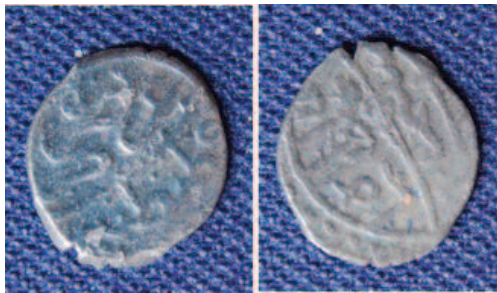
Egy, valószínűleg kelta ezüst érme

Tököl helytörténeti kutatásának lényeges részét képezi a keresőműszeres terepbejárás, mely nem keverendő össze a köztudatban elterjedt, és napjainkban egyre népszerűbb fémkeresős „ kincskereséssel ”. Ez utóbbi legtöbbször anyagi, de legalábbis saját érdekből történik, míg a hivatásos fémkeresőzés az illetékes múzeumok munkáját hivatott segíteni. Azt sem szabad elfelejteni, hogy a fémkeresőzés, csakúgy, mint pl. a horgászat, helyhez és engedélyhez kötött tevékenység, melyet a hatóságok egyre komolyabb szabályozással igyekeznek kordában tartani. De mindezen szabályok nélkül is belátható, hogy nemzeti örökségünk megőrzése, legyen az a földben, vagy a víz mélyén, közös érdekünk, melyet saját céljaink elé kell helyeznünk.