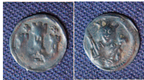
III. András ezüst denárja

Városunk első írásos említése – jelenlegi tudásunk szerint – egy XIII. századi oklevélben történt. Ebből az időszakból származik az a két ezüst denár is, melyet szintén a Duna-parton találtam.