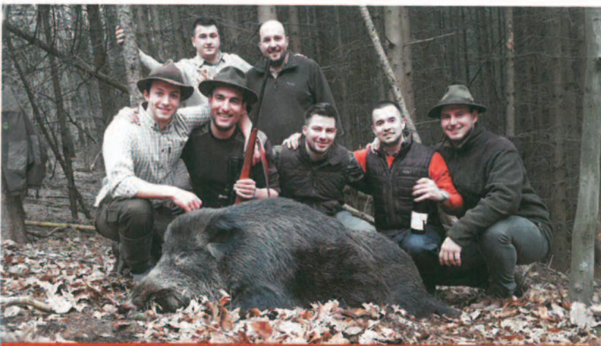
"Ez a vadászat azért jöhetett létre, mert mi itt találkoztunk, az egyetemen"

– Amint a tavalyi véget ért, fejben már készültünk a következőre. A szervezés február közepén rajtolt. Nem iz-