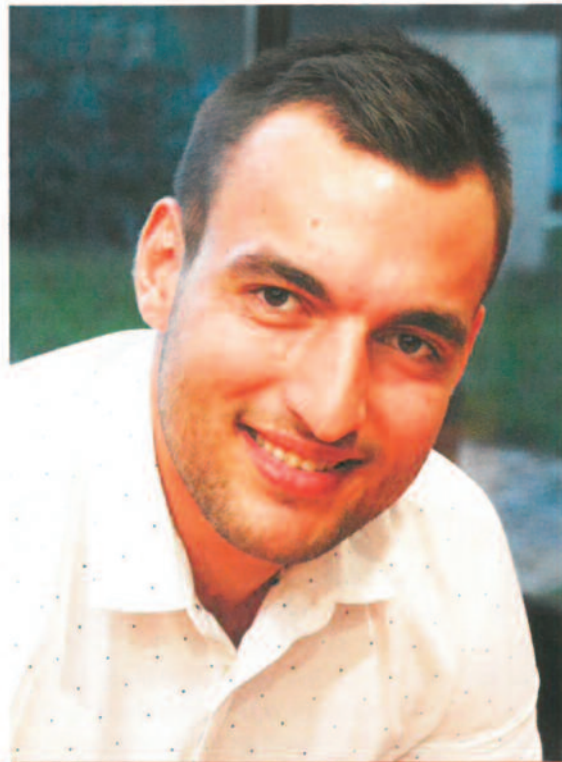
"A Ledinán döntöttem el, hogy állatorvos szeretnék lenni"

– Rendkívül fontos az állatorvosi szemlélet, ez a meggyőződés. Úgy gondolom, hogy az állattenyésztő tudja, hogy mit csinál, viszont az állator-