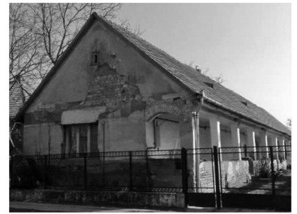
9. Fő út 100. Lakóház (hrsz.: 605/1)