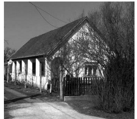
12. Fő út 139. Lakóház (hrsz.: 2307)