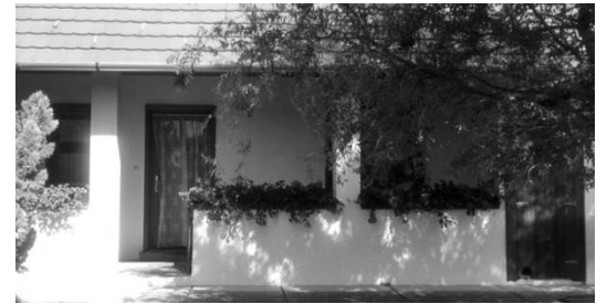
2. Dózsa György utca 12. 1930-as években épült vályogház, felújítása, hagyományörzése minta értékű. (hrsz.: 787/1)