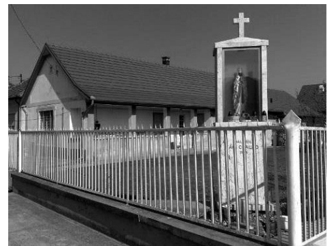
14. Iskola utca 3/1. Lakóház (hrsz.: 931/1)