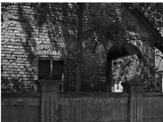
5. Fő út 33. Lakóház (hrsz.: 50)