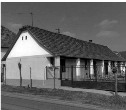
15. Kossuth Lajos utca 30. Lakóház (hrsz.: 691)