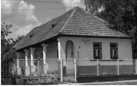
2. Hősök tere 3. lakóház (hrsz.: 2322)