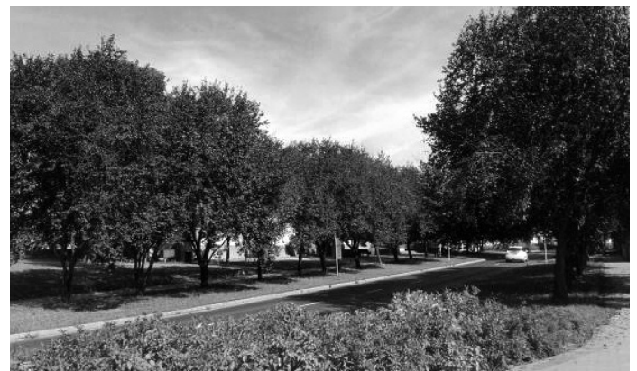
16. Vérszilva ( Prunus cerasifera 'Nigra') fásor, Fő utca 2325 hrsz-ú út és a 6/2 hrsz-ú út között, illetve a Fő utca 1057 hrsz. előtt.