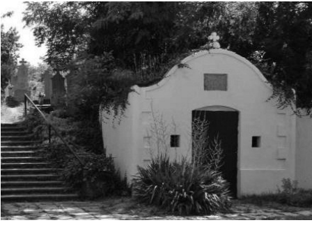
1. Fő utcai katolikus temető (hrsz.: 144)