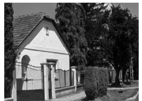
6. Fő út 37. Lakóház (hrsz.: 47)