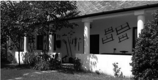
1. Zrínyi utca 13. Tájház (Bonhardt ház) 3 épületből álló épület együttes. Német tájház. (hrsz.: 534)