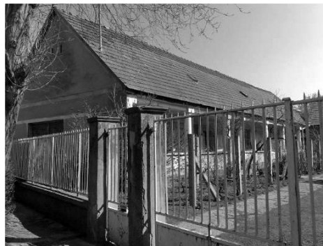
11. Fő út 128. Lakóház (hrsz.: 2202)