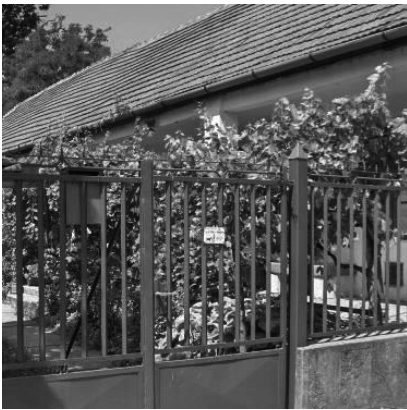
7. Fő út 47. Lakóház (hrsz.: 42)