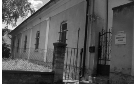
3. Rk. Templom melletti plébánia épülete (hrsz.: 2324)