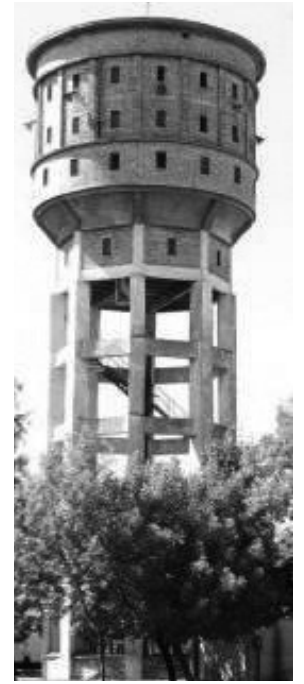
4. A Börtön területén lévő víztorony (hrsz.: 0165/5)