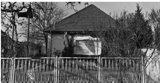
3. Fő út 109. Református lelkipásztori hivatal és harangláb (hrsz.: 11)