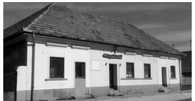
4. Kossuth Lajos utca 28. (hrsz.: 690/1)