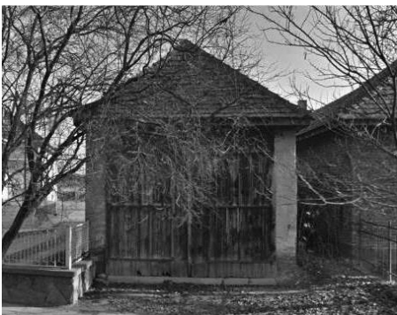
10. Fő út 96. Fészer (hrsz.: 597)