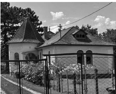
13. Aradi utca 35. Lakóház (hrsz.: 1207)