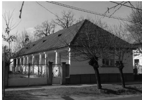
8. Fő út 51. Lakóház (hrsz.: 40)